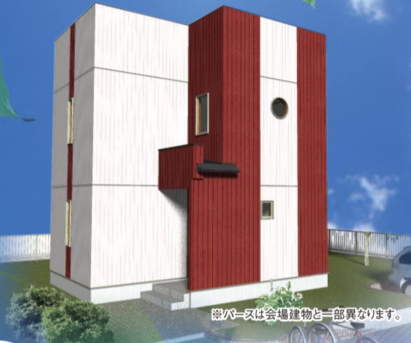
※パースは会場建物と一部異なります。